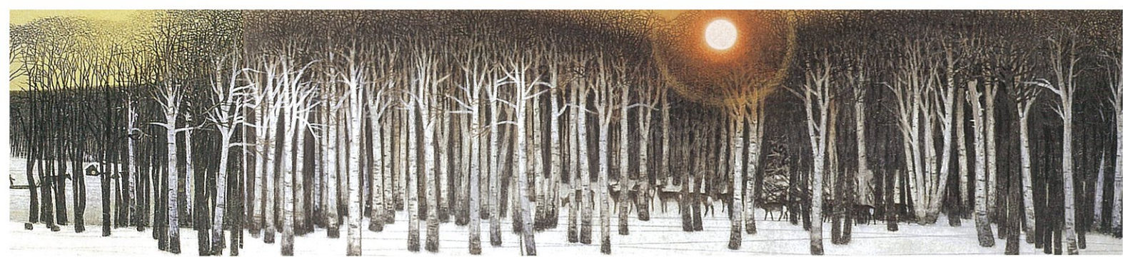
〈道産子追憶之巻〉(部分) 1978-82 高精細複製画 本画は北海道立近代美術館蔵