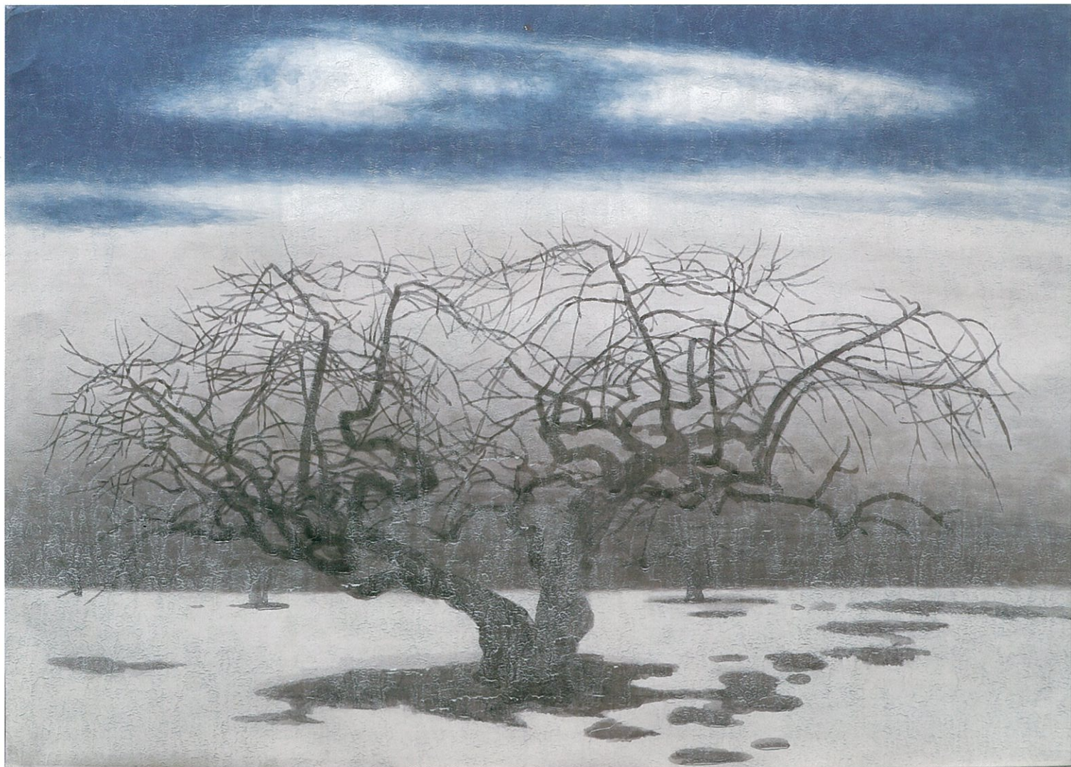
岩橋英遠作 作品名、制作年不明