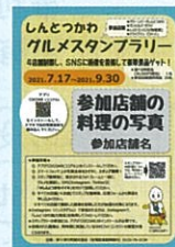
AR マーカーイメージ

01 レストラン内の各テーブルに設置している AR マーカーにスマートフォンをかざすと、スタンプ獲得!